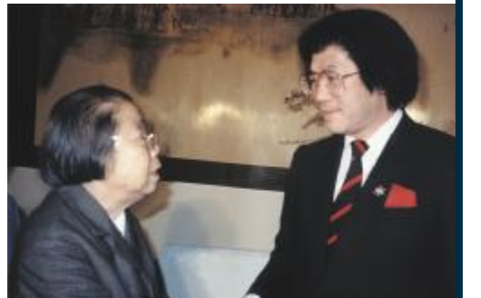
1985年，政協主席鄧穎超接見黃錦波。