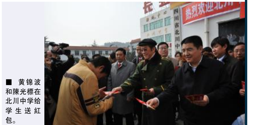
黃錦波和陳光標在北川中學給學生送紅包。

黃錦波有着招牌式的打扮，那就是永遠佩戴絲巾和墨鏡。他接受時尚雜誌採訪時，對記者說：「人要成功也要跟產品一樣，要突出品牌。香港有位特首出名是『煲呔曾』，美國有我這位『頸巾黃』。一方面保護我的白恤衫領不易黑和污，二來不用領帶，觀眾在電視上忘記我是誰，但看到頸巾就記起來了。」其自身成功的品牌塑造，使得黃錦波成為十多家公司的形象代言人。