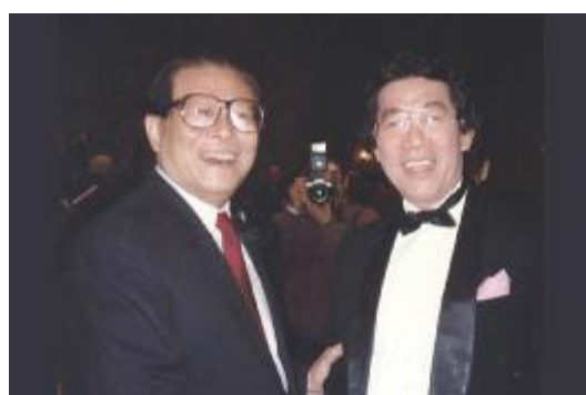
前國家主席江澤民和黃錦波親切交談。

黃錦波共9次到台灣，通過自己的電視台，讓美國觀眾了解兩岸統一是所有中國人的心願。2006年5月他曾給陳水扁寫信，建議他放棄台獨。2006年9月，他也給馬英九寫信，讓其不要參加倒扁活動，建議他以退為進，愛惜自己的聲譽。同年6月，馬英九則聽取了他的建議，並在11月致信表達感謝。