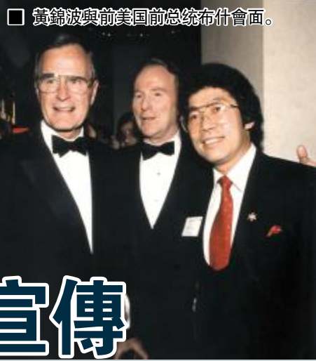
黃錦波與前美國總統布希會面。